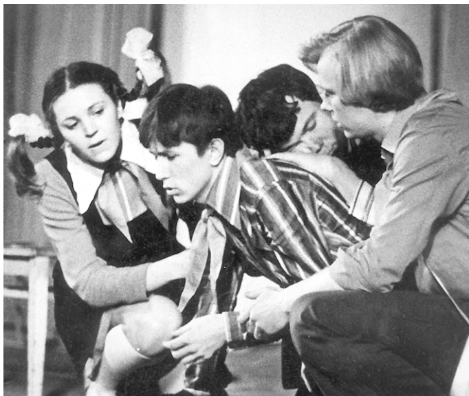
1979 год. «Весна в ЛЭТИ». Сцена из спектакля факультетского студенческого театра.